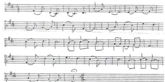
Melody of the Auschwitz Song (from a German folk tune)